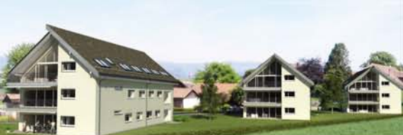
Attention les images sont indicatives et non contractuelles