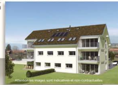
Attention les images sont indicatives et non contractuelles

Les bâtiments s'intègrent dans un paysage villageois en reprenant les lignes rurales, adroitement associées à une composition de façades plus contemporaine. La sobriété de ces dernières est caractérisée par de larges ouvertures dans les espaces de vie et des ouvertures ponctuelles dans la partie plus massive des bâtiments qui assurent la tranquillité des pièces de nuit. Les espaces intérieurs sont généreux et se prolongent à l'extérieur par de grands balcons ou de vastes terrasses. L'aménagement des parkings au nord de la parcelle et en sous-sol permet de préserver la beauté du site tout en facilitant l'accès au pied des bâtiments.