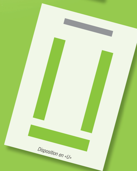
Disposition en «U»